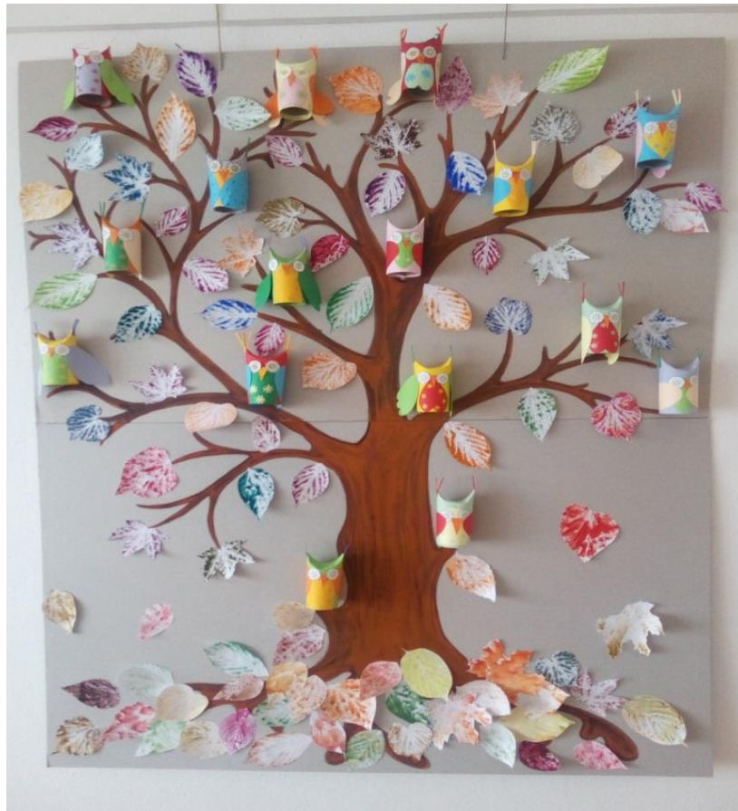
Z tvorby obyvateľov lôžkového oddelenia.

V tejto časti Vás budeme informovať o dianí na lôžkovom oddelení. Dozviete sa o živote obyvateľov z lôžkového oddelenia a aj o tom čo všetko tvoria a zažívajú.